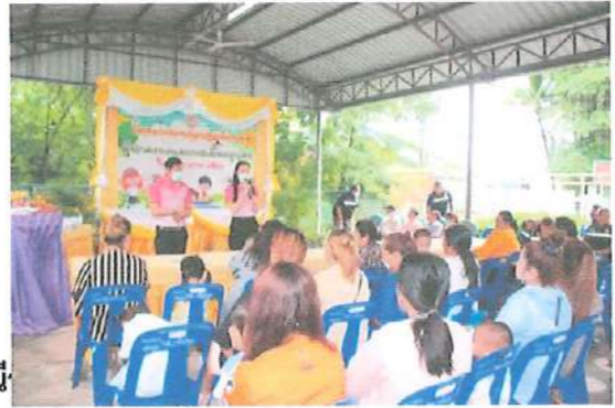
โครงการประเพณี